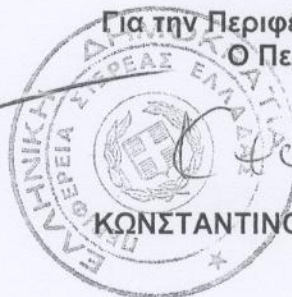
ΚΩΝΣΤΑΝΤΙΝΟΣ Π. ΜΠΑΚΟΓΙΑΝΝΗΣ

Για την Περιφέρεια Στερεάς Ελλάδος Ο Περιφερειάρχης