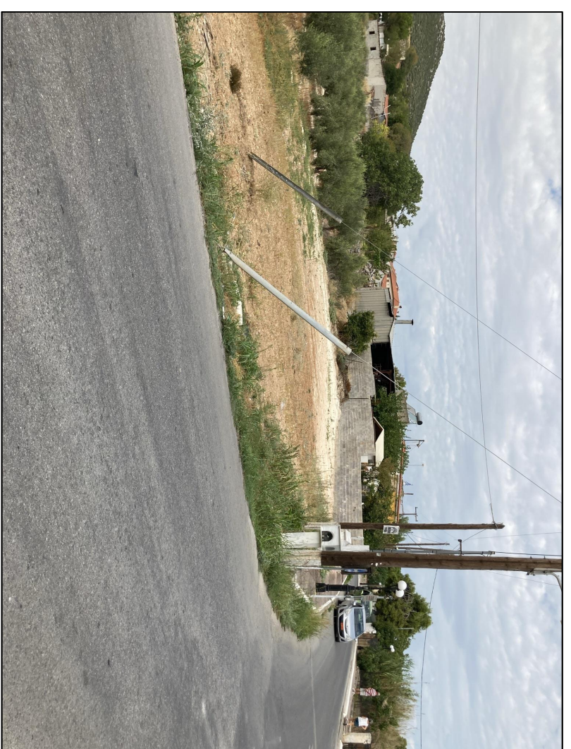
ΦΩΤΟΓΡΑΦΙΑ ΑΠΟ ΒΕΣΤΗ ΜΗΜΗΤ 1