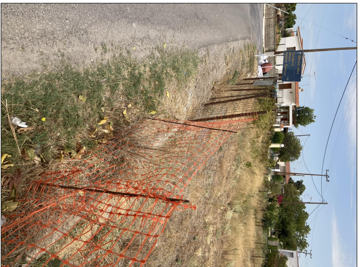
ΦΩΤΟΓΡΑΦΙΑ ΑΠΟ ΒΕΣΤΗ ΜΗΜΗΤ 2