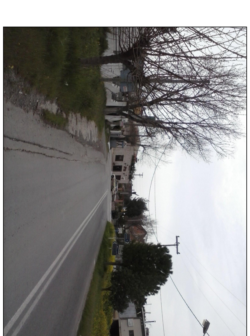
ΦΩΤΟΓΡΑΦΙΑ ΑΠΟ ΒΕΣΤΗ ΓΩΝΙΑ 3