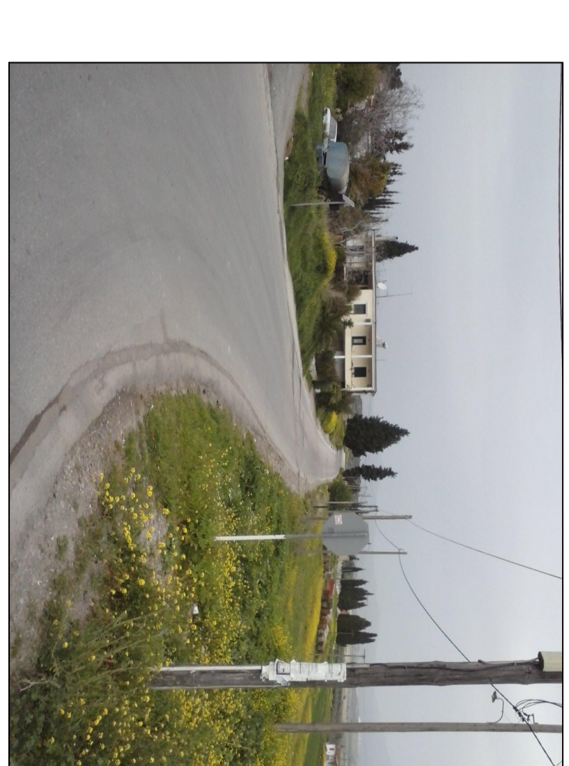
ΦΩΤΟΓΡΑΦΙΑ ΑΠΟ ΒΕΣΤΗ ΓΩΝΙΑ 2